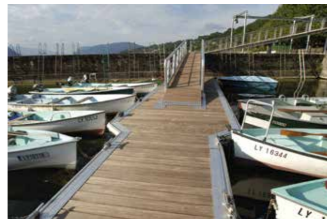
Ponton du Lac du Bourget (73) — Platelage chêne naturel classe 4