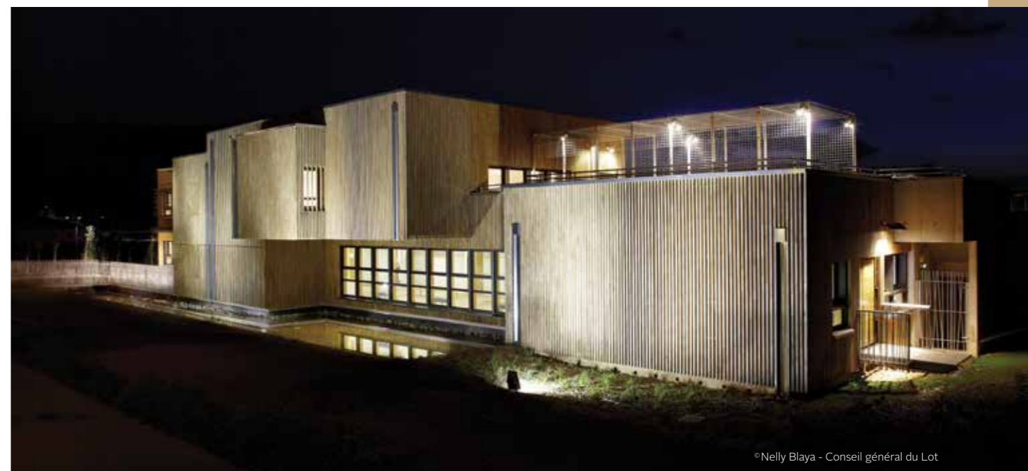
Maison du département du Lot (46) — Bardage en chêne naturel abouté Architecte Philippe Berges