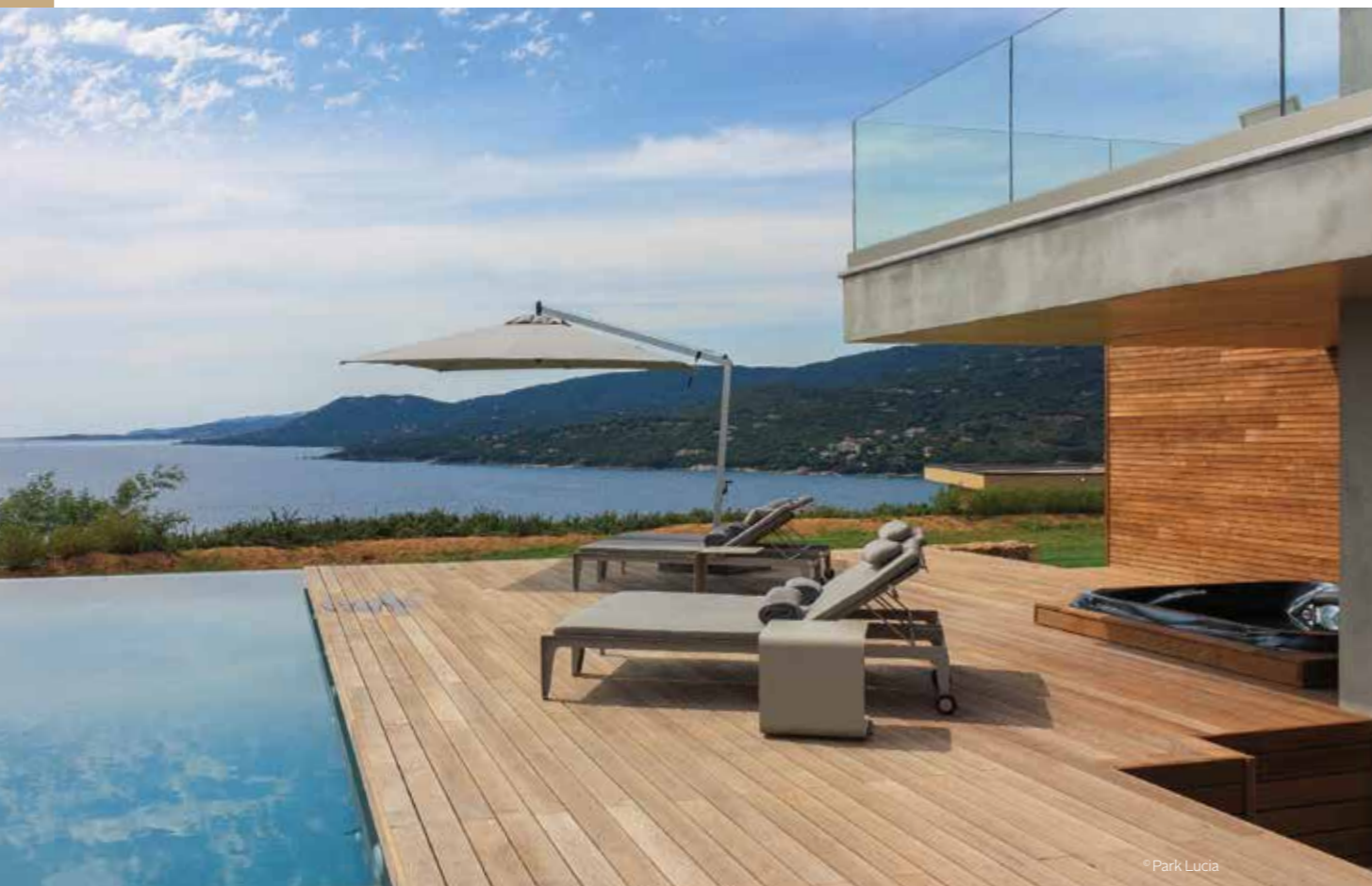
Casa Lucia (20) — Terrasse et bardage en frêne THT Côtéparc®