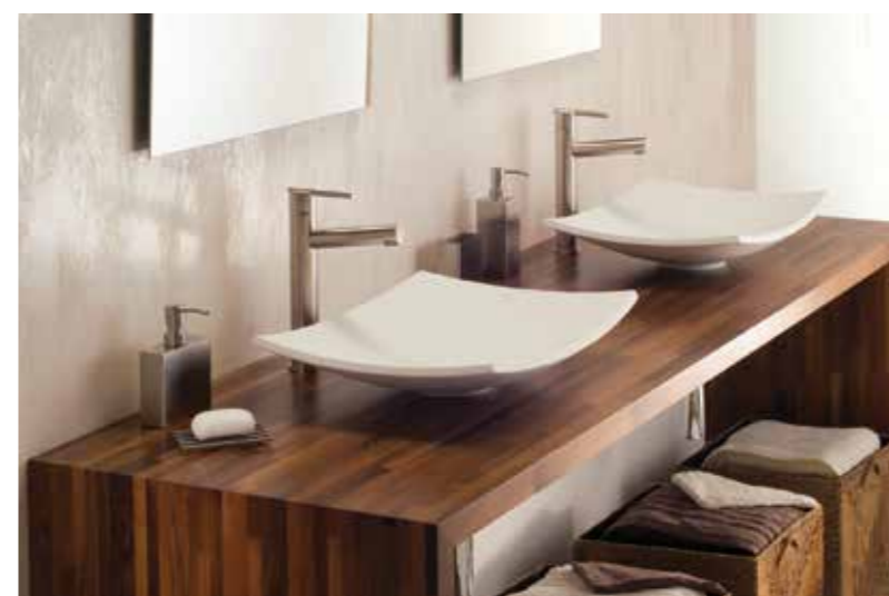
Meuble de salle de bain en panneau Patchwood® — Essence noyer