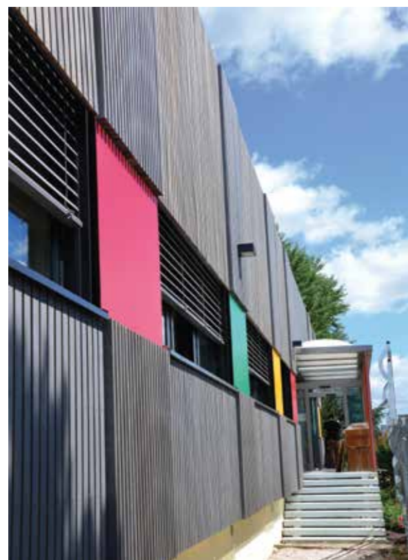
Cetic (71) — Bardage en peuplier THT - Finition Rubio Monocoat® gris vieux bois - Architecte Olivier Le Gallée