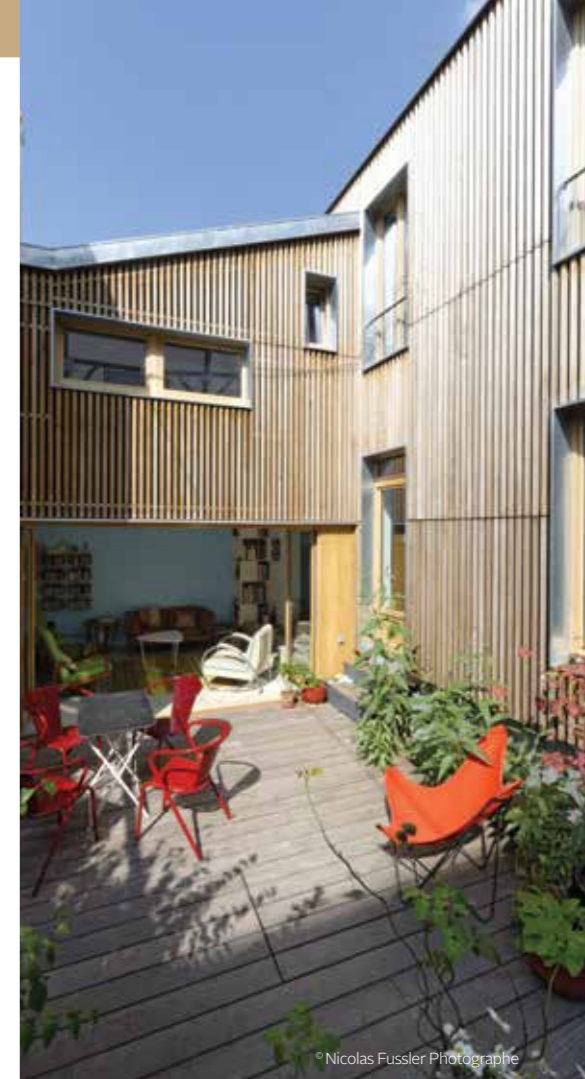
Pré St-Gervais (75) — Bardage en peuplier THT Côtéparc® Verdier-Rebière Architectes