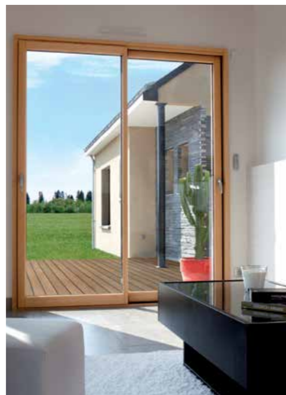
Fenêtre mixte bois-alu : Carrelet chêne Profileo®